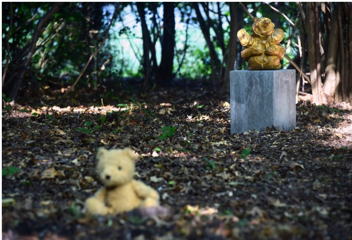
Beertje Pouf op het asstrooiveld.

Voor aanstaande ouders is het een zware tijd - vaak moeten ze na een slechte uitslag bij een twintigwekenecho snel beslissen tussen een zwaar gehandicapt kind of een abortus. Het is een woord dat, net als miskraam, in de uitvaartbranche liever wordt vermeden. 'Miskraam verhult dat het een kindje is. Het is een onmogelijke keuze', zegt Thijssens.